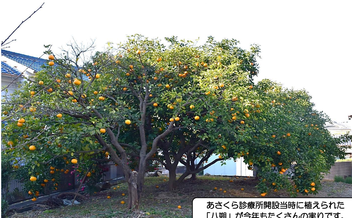
あさくら診療所開設当時に植えられた 「八朔」が今年もたくさんの実りです。

ニュースの配達、封 筒詰めにご協力く ださい。 「やましろ健康医 療生協ニュース」は 毎月3500部を 発行しています。 毎月24日午前中 (土・日・祝日は翌 日)に封筒詰め作業 を行っています。 封筒詰めは午前 9時から10時半頃 までです。また、地 域での配達にもご 協力お願いします。