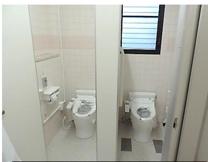
改装されたトイレ

その後、歯科を開設し介護事業にも取り組んできました。毎年の総代会では、組合員さんから、診療所を利用したいが、高齢になり通院が困難になってきた。トイレが開設以来の和式で利用しづらい。出入り口の自動ドアが一枚で、冬場はホールで待っていると開閉のたびに冷気が入ってくるなどのご意見が