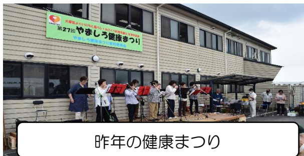
昨年の健康まつり