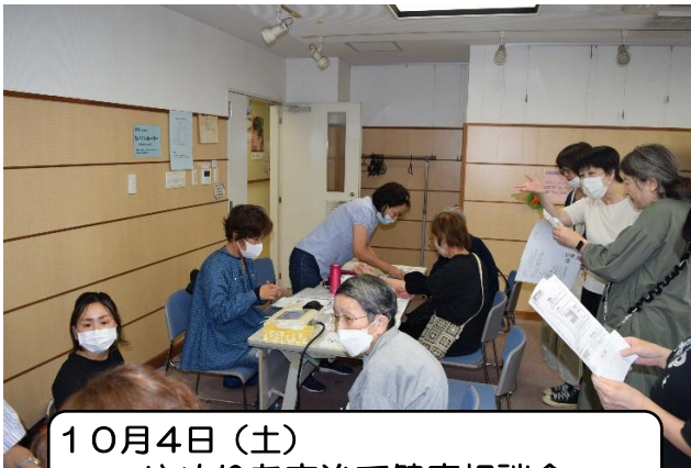
10月4日(土) ゆめりあ宇治で健康相談会